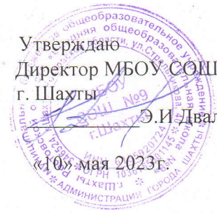
График работы летнего оздоровительного лагеря МБОУ СОШ № 9 г.Шахты с дневным пребыванием детей «Солнечный город», организованного на базе МБОУ СОШ № 21 г.Шахты