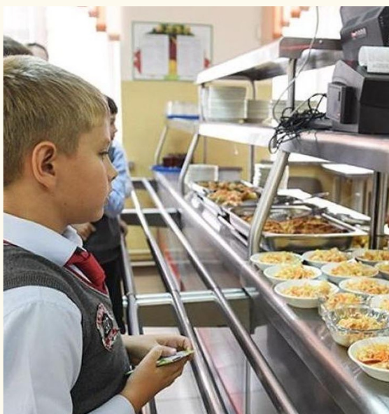
Учащиеся 1 - 4 классов